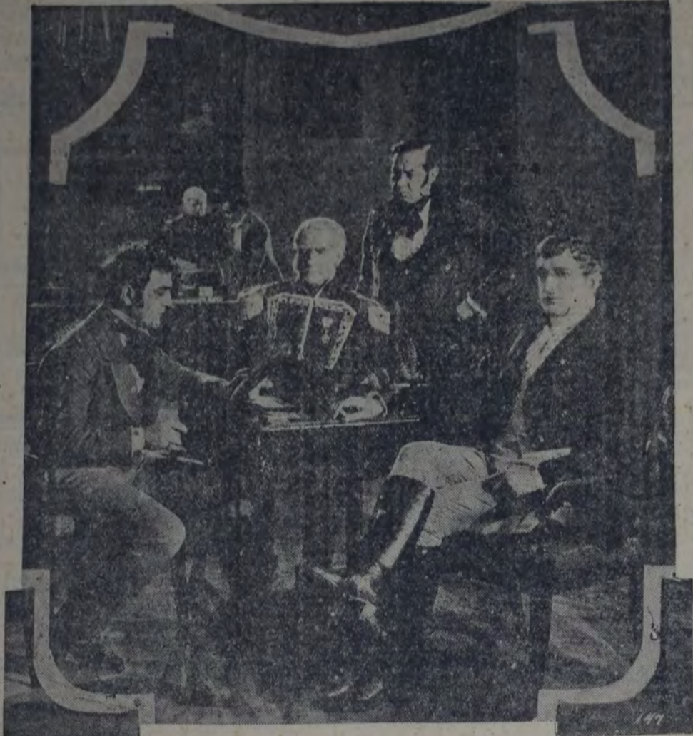
Una escena de "Una nueva y gloriosa nación", episodio romántico de la independencia argentina

El cinematógrafo, que tan señalados servicios presta a la humanidad actual y al que el porvenir reserva, sin duda, una misión trascendental sobre la tierra, se ha manifestado ya como un elemento histórico imprescindible. Si fuera menester un punto de referencia para fundamentar nuestro aserto, tendríamos como primer ejemplo las escenas de toda índole que el objetivo recoge durante la última gran conflagración europea. Pero si esa referencia tiene para la humanidad un limitado valor histórico, para los argentinos no podía ser menos interesante un film en el que, a modo evocativo, se reconstruyeran las escenas culminantes de nuestra emancipación y surgimiento a la vida independiente.